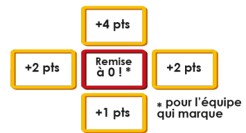
Valeur des cibles

Gagner son match : Être le premier à atteindre un score de 20pts ou plus.